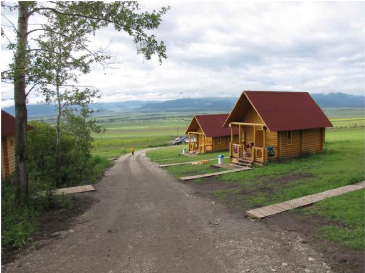
Домики для участников турнира как нарисованные.